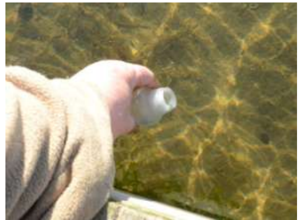
Jeg tager prøven fra broen.

Så analyserede vi de to prøver. Der tilsættes en klar sølvnitrat-opløsning til begge reagensglas. Det bliver hvidt, hvis der er salt i prøven. Prøven fra strømmen viser ingen reaktion. Så her er der ingen salt.