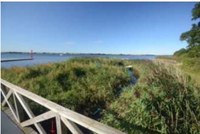
Vandløbet løber ud i havet.

Vi kom til et sted, hvor et lille vandløb løber ud i havet. Første billede viser, hvor strømmen løber ud i havet. De røde pile viser, hvor vandprøverne blev taget. De blå pile viser retningen af strømmen.